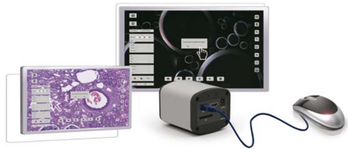
Caméra HDMI Autonome