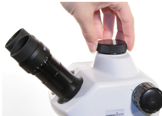
Adaptateur optique monture C

Avec cette version trinoculaire du stéréomicroscope vous pouvez observer la préparation et simultanément effectuer un cliché photographique ou une vidéo. Pour utiliser cette sortie trinoculaire il vous faut sortir le capuchon (photo ci-contre) et visser à sa place l'adaptateur optique monture C (photo ci-dessous).